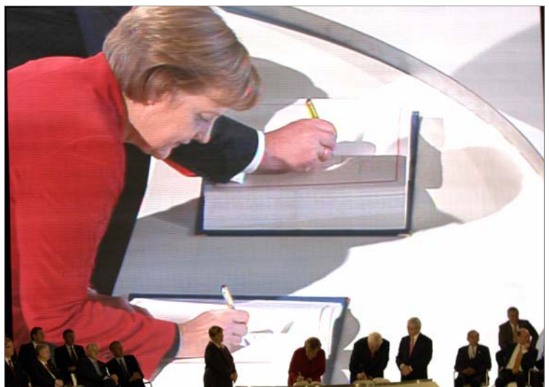
Bundeskanzlerin Angela Merkel unterzeichnet den EU-Reformvertrag